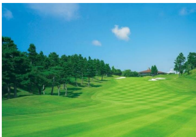
近鉄賢島カンツリークラブ