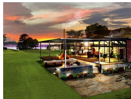
グランピング施設イメージ（ラグジュアリー棟）