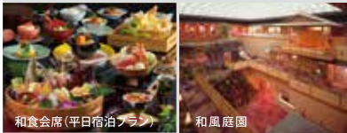
和会席(平日宿泊プラン)