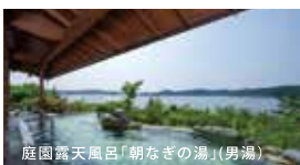
庭園露天風呂「朝なぎの湯」(男湯)

●IN/15:00●OUT/10:00●お部屋/〈燦陽棟〉※2名1室利用●ご夕食/レストランまたは宴会会席和会席(※写真:桶盛りは2名・天婦羅は4名盛り)●ご朝食/レストランまたは宴会場バイキングもしくは和食セットメニュー(料理はおまかせとなります。)