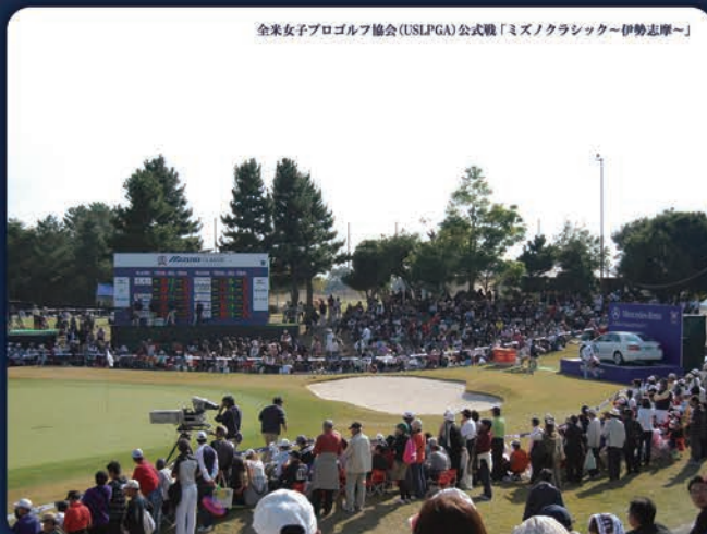
全米女子プロゴルフ協会 (USLPGA) 公式戦「ミズノクラシック～伊勢志摩～」