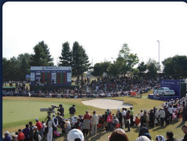
全米女子プロゴルフ協会(USLPGA)公式戦「ミズノクラシック～伊勢志摩～」